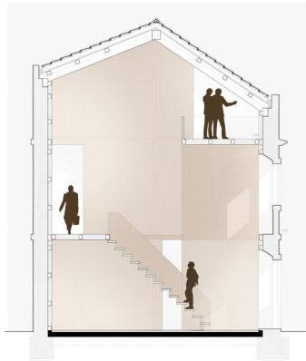
Casa Tzaharim Miro - Casa III