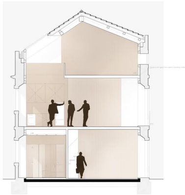
Casa Tzaharim Miro - Casa IV