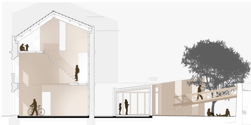
Casa Jovera Jorhita - Casa IGD