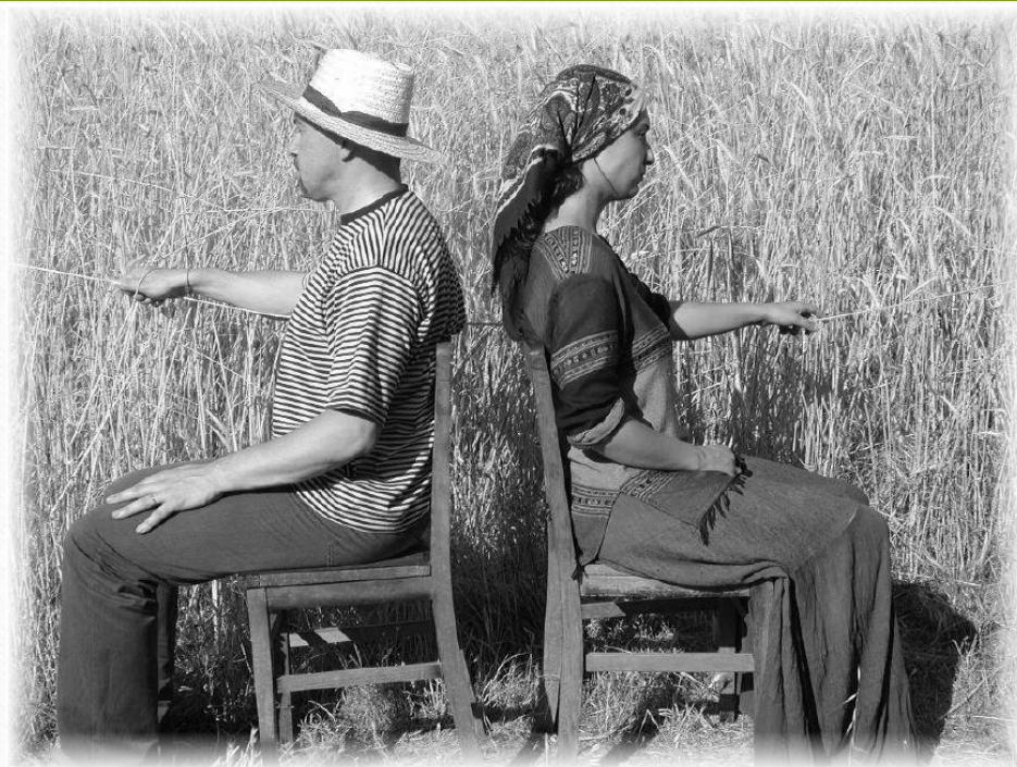
Chuchurumel, Posta restante, Casório divertido. 417