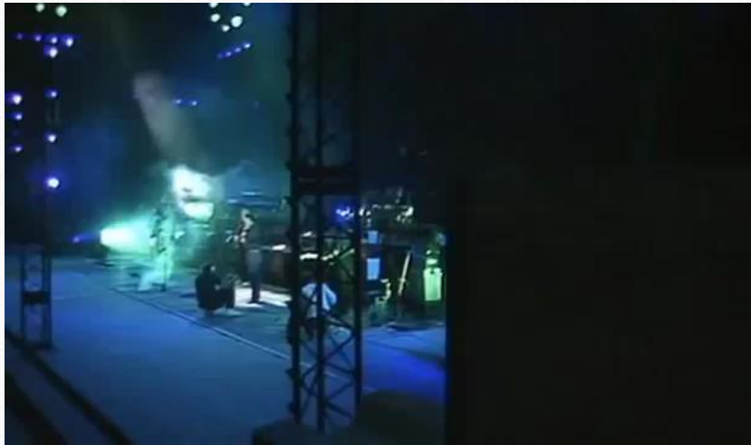
Roger Waters The Wall , Pink Floyd, Berlin 1990 Gesamtkunstwerk