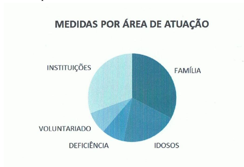
Figura II – Programa de Emergência Social 2011: medidas por área de atuação

No PES, o Governo identifica cinco áreas de atuação prioritária, a saber: as famílias, os idosos, os deficientes, o voluntariado e as instituições, definindo como se verifica na Figura II o nível de prioridade de cada uma delas.