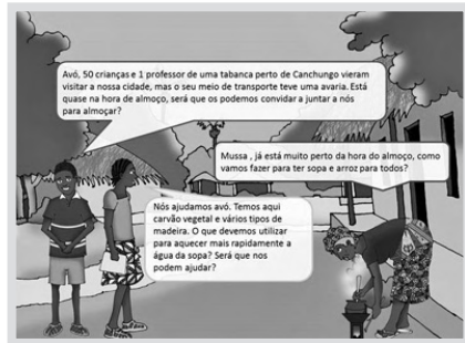
Figura 2 Situação problema de introdução ao protocolo Tipos de Combustível