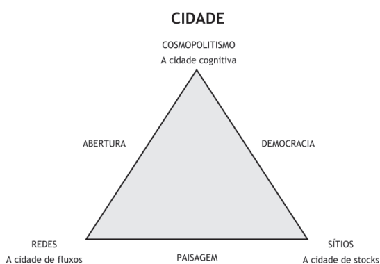
Figura 1 – O triângulo de entendimento da Cidade (Ferrão, 2003)

Assim, e em primeiro lugar, sigamos precisamente Ferrão, na sua proposta de entendimento da cidade, visando os novos desafios de postura e de acção sobre ela (id.). Uma proposta de inteligibilidade cuja excepcionalidade, no nosso entender, se coloca numa muito interessante conjugação entre uma conceptualização sistémica de natureza holística com uma potencial capacidade de tradução em sistemas concretos de governabilidade e de acção sociopolítica. Numa clara alusão (não escrita) entre a cidade e um ser vivo – muito provavelmente evocando a perspectiva, de todo meramente metafórica, de encarar o sistema urbano como um ecossistema – o autor propõe o entendimento da cidade por intermédio de três grandes ingredientes que personificam o corpo, a vida e a alma.