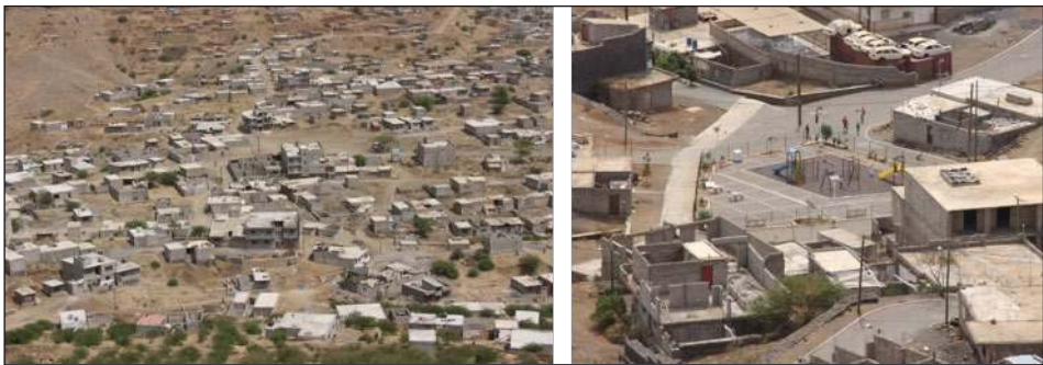
Figura 5: Expansão da Cidade da Praia e exemplo de requalificação do espaço público (A. S. Fernandes)

Desta forma, mais do que contrapor as diferentes estratégias de intervenção – provisão habitacional versus requalificação do existente –, urge antes avaliar e discutir a sua extensão, o seu efectivo impacto na melhoria das condições de vida e, acima de tudo, analisar o perfil dos beneficiários abrangidos, para que as situações mais críticas e de maior privação constituam, de facto, a prioridade de intervenção das políticas urbanas, objectivo que recorrentemente acaba por ser secundarizado face a outros objectivos. Nesse enquadramento, um dos maiores desafios da actualidade para a equidade será debater e reequacionar o papel da governação local, assim como a responsabilidade (política) dos técnicos incumbidos da análise e gestão do ambiente construído.