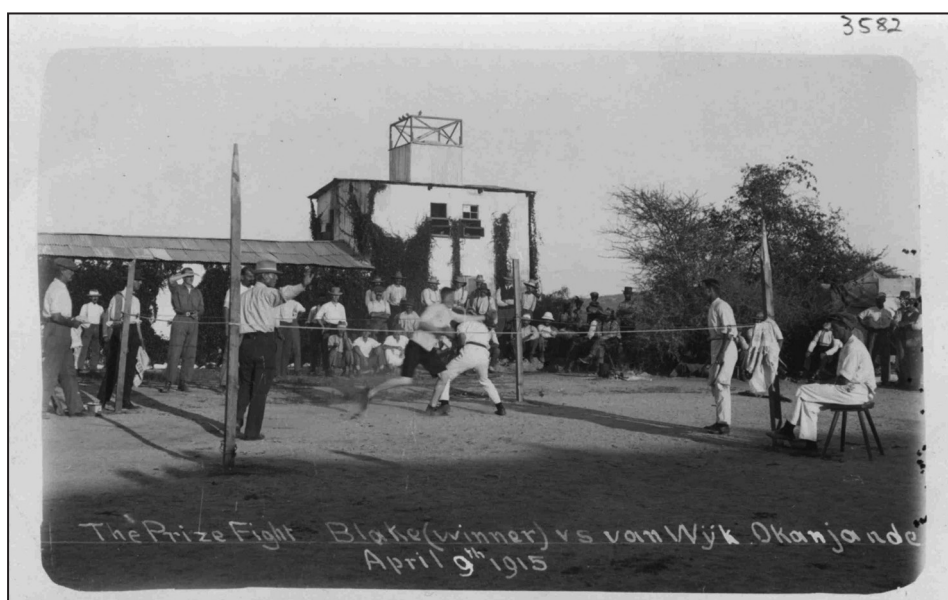
Figura 1: Luta entre Blake e van Wyk, Okanjande, 9 de abril de 1915 © National Archives of Namibia (Windhoek), Foto Nr. 3582

Para as colônias alemãs, uma copiosa iconografia permite inferir que o esporte e o lazer foram privilégios dos brancos. A posição que ocupam alguns africanos nas fotografias é reveladora das barreiras sociais do campo desportivo e do lazer. Um exemplo é a imagem da luta de box entre Blake e van Wýk, realizada em Okanjande no dia 9 de abril de 1915 (figura 1). Através do ângulo escolhido pelo fotógrafo, percebe-se uma assistência branca e masculina. Todavia, essa fotografia contém aquilo que Roland Barthes (2015, p. 42) denominou de punctum , ou seja, um detalhe dado por acaso 4 . Nessa imagem do pugilato, tem-se, ao fundo, três ou quatro espectadores negros, sendo que dois ou três podem ser crianças pela estatura.