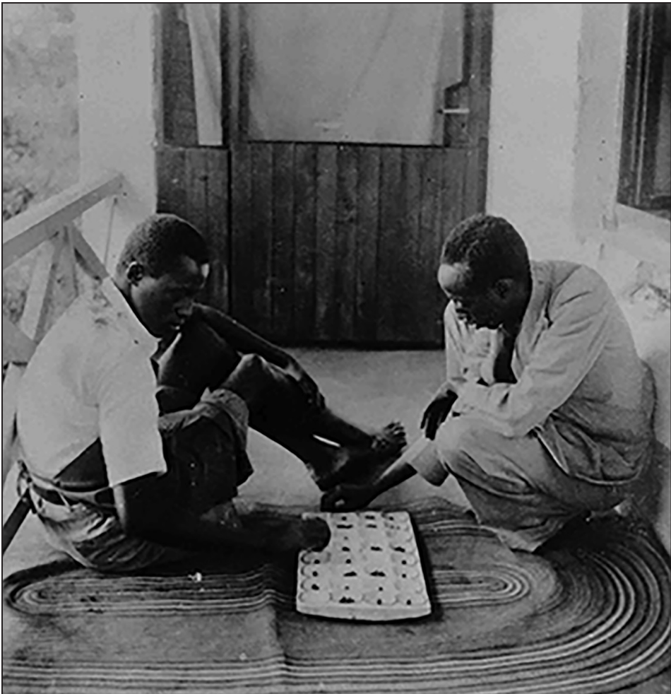
Figura 5: Jogo de tabuleiro (Bukoba, na atual Tanzânia, s/d.)

Como pode-se inferir do testemunho do médico alemão durante a sua passagem pela Serra Leoa, algumas mulheres se prontificavam a posar. Mas nem todas. A recusa de algumas em deixar-se fotografar não garantia que o botão das máquinas fotográficas não fosse disparado. Muitos africanos foram fotografados à revelia de sua vontade.