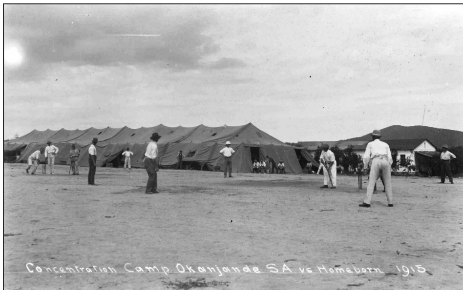
Figura 2: Jogo (cricket?) entre sul-africanos e “nativos” no campo de concentração de Okanjande (1915) © National Archives of Namibia (Windhoek), Foto Nr. 3583

No entanto, em condições extremas ou excepcionais, seja numa zona de mineração ou num campo de concentração, algumas fotografias registam momentos de descontração e mesmo lúdicos. Um exemplo é a partida improvisada de críquete (ou basebol?) entre “sul-africanos” e “nativos” num campo de concentração no sudoeste africano em 1915 (figura 2). Cabe lembrar que os campos de concentração foram usados durante as guerras anglo-bôeres na África do Sul e também na colônia alemã do sudoeste africano durante a Primeira Guerra Mundial.