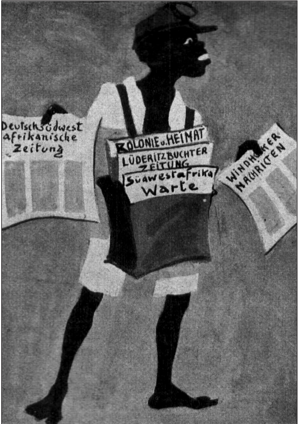
Figura 6: Jovem jornaleiro a vender periódicos da imprensa da colônia alemã do sudoeste africano