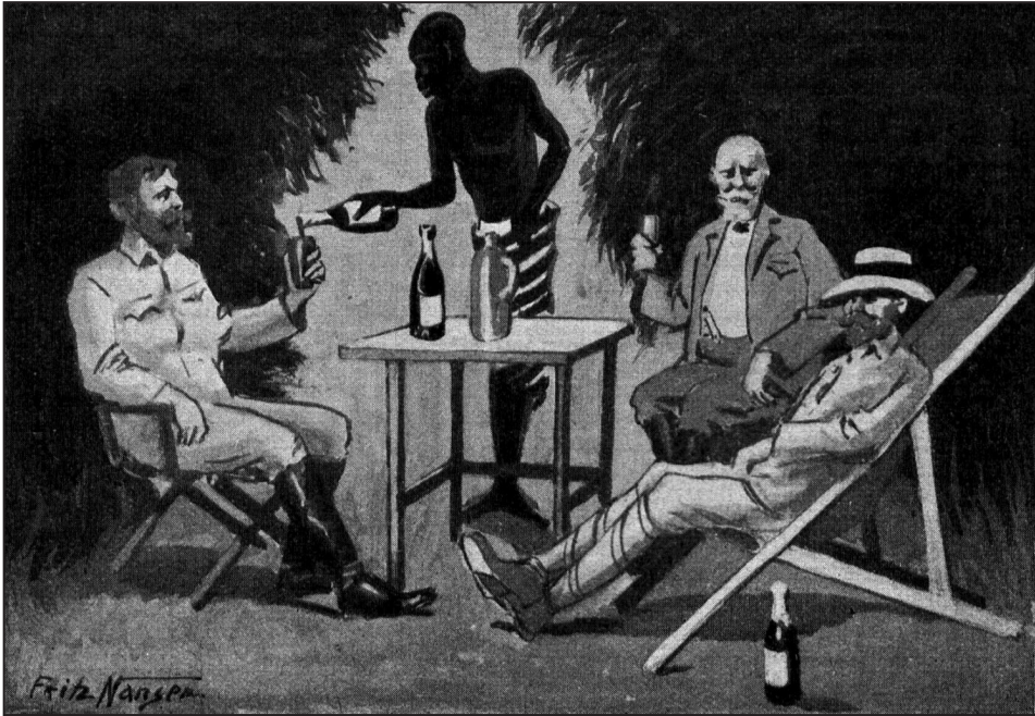
Figura 4: Ilustração de Franz Nansen de um artigo sobre a hospitalidade na África Oriental

Como outras práticas desportivas, a caça exigia um repouso que, geralmente, era feito no acampamento. Feita ao ar livre, a reunião entre os caçadores se fazia com a imprescindível bebida alcoólica e importada. Relatos de caçadores narram esse momento noturno de lazer entre os caçadores brancos 8 .