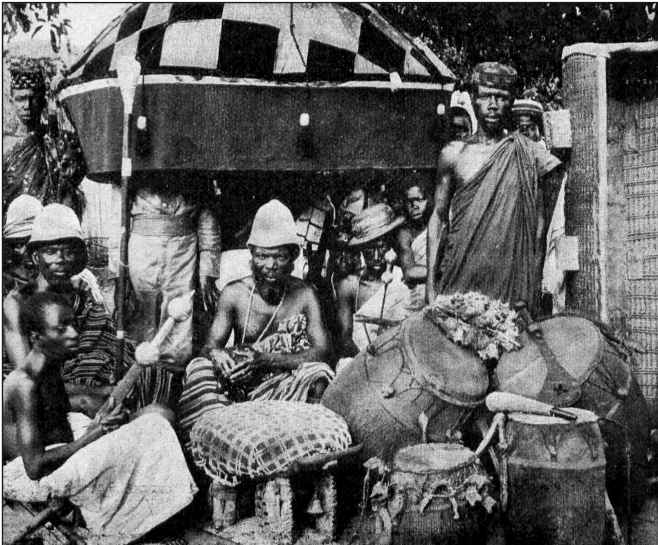
Figura 3: O régulo de Ho e seu séquito participando das comemorações da Festa do Kaiser em Lomé (Togo)

Na África sob domínio colonial alemão, as autoridades alemãs convidavam os régulos locais e seus súditos a participar da festividade. O feriado permitia uma celebração onde civis e militares, homens e mulheres, europeus e africanos participavam de acordo com as hierarquias da ordem colonial.