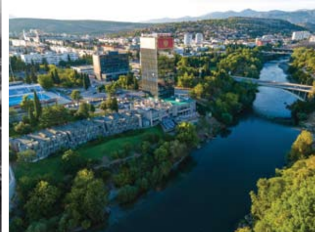
Okolica hotela »Podgorica« takoj po izgradnji in danes na fotografijah dveh podgoriških fotografov, očeta in sina.