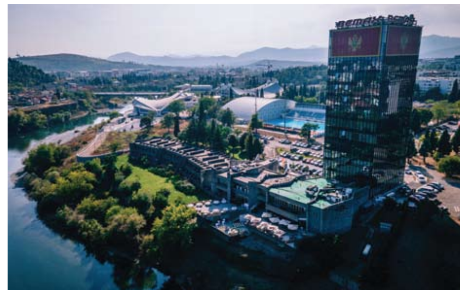
Originalni koncept urbane umestitve hotela »Podgorica« je danes okrnjen in zožen zaradi privatizacije zemljišča ter zaradi planiranja in realizacije intenzivne zazidave desnega obrežja Morače.

Danes se zdi, da bi vendarle bilo bolje, če bi, brez opravičevanja in pojasnjevanja, rekel »neimarka« – ampak na začetku 2000-ih žal še ni bila mogoča smiselna debata o pomenu spolno občutljivega jezika v akademskih krogih.