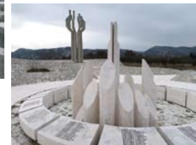
Spomenik padlim borcem Lješanske nahije na Barutani pri Podgorici.