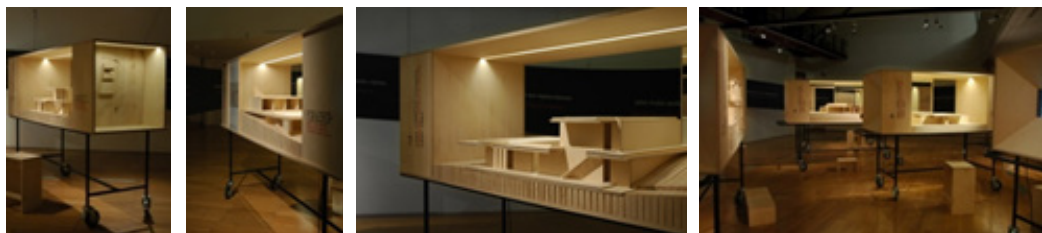
Fig. 3. Fotografii din cadrul expoziției Falemos de Casas em Cascais . ((Mendes, 2010)/Photographs of the exhibition Falemos de Casas em Cascais (Mendes, 2010)