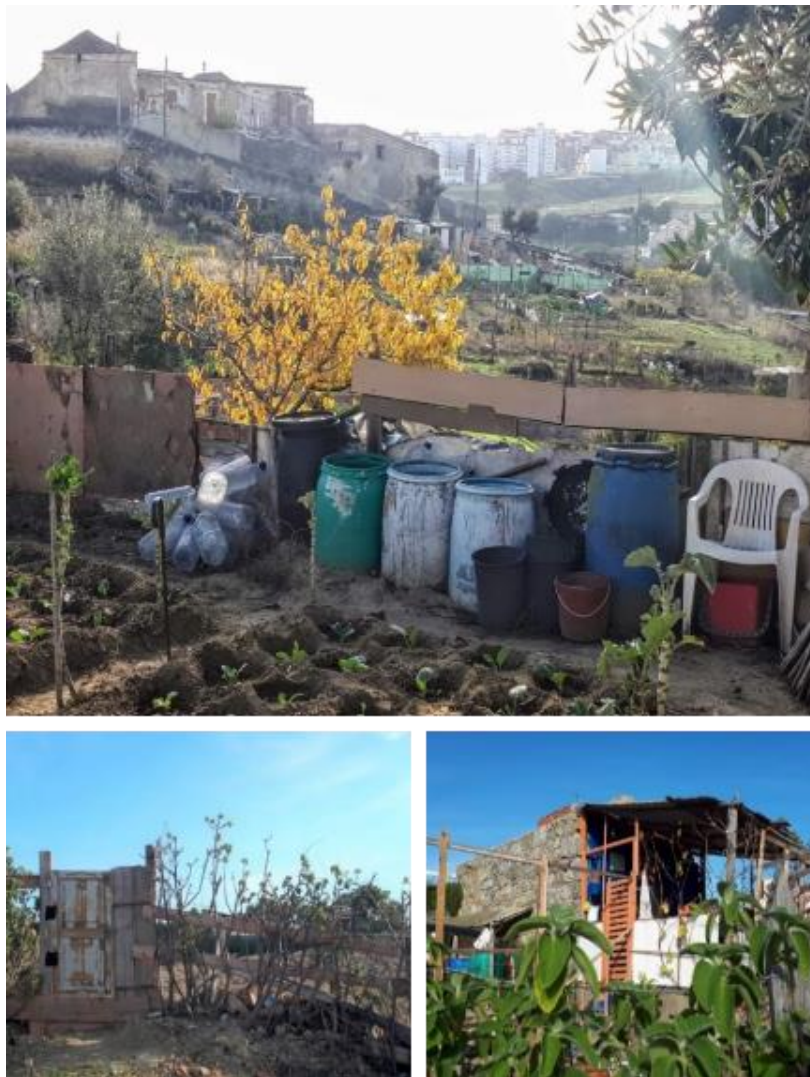
Figura 2. Imperfeições e assimetrias: horta espontânea no Condado. Chelas. Lisboa

Para além do pitoresco, essa estética pode também emergir de uma cosmovisão em que homem e meio constituem um todo orgânico, indissociável, resultando na profunda ligação entre recursos (humanos e materiais) e ciclos da natureza, o que condiciona modos de ser-agir longe dos padrões “produtivo e higiênico” que a cultura estabelecida impõe (Nagib, 2020; Scapinelli, 2018; Montaner, 2012). O “abandono, o desmazelo, o inacabado ou o degradado”, valores tradicionalmente atribuídos aos vazios urbanos das hortas de Lisboa (Barata-Salgueiro, 2019, p. 85), ou a “desorganização, com imenso lixo e ervas daninhas 4 ”, como julga o poder estabelecido (Renascença, 2016), podem ser entendidos como expressões de uma “cultura alternativa”, compreendida aqui muito além da “arte engajada” (Carmo et al., 2014). Frente às ordens vigentes que impõem pouca disponibilidade de tempo, precariedade financeira, ou necessidade de constituição de um efêmero sobre terras, da qual não se tem propriedade, esses sujeitos buscam, de modo espontâneo, orgânico e participativo, outras “alternativas” ou possibilidades para transformar e se apropriar do espaço. Sem projetos ou ideias preconcebidas, ao recorrerem ao artesanal, à reciclagem, ao “faça-você-mesmo”, expressam subjetividades que, em conjunto, alcançam unidade estética e expressam uma identidade (Carmo et al., 2014). (Figura 2)