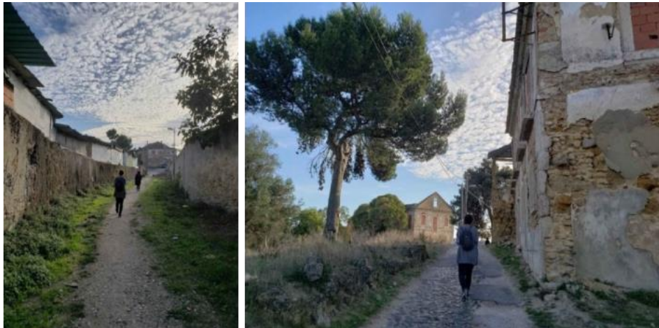
Figura 5. Percursos no “estranho à cidade”. Prática “A Cada Passo, uma Constelação”. Chelas. Lisboa