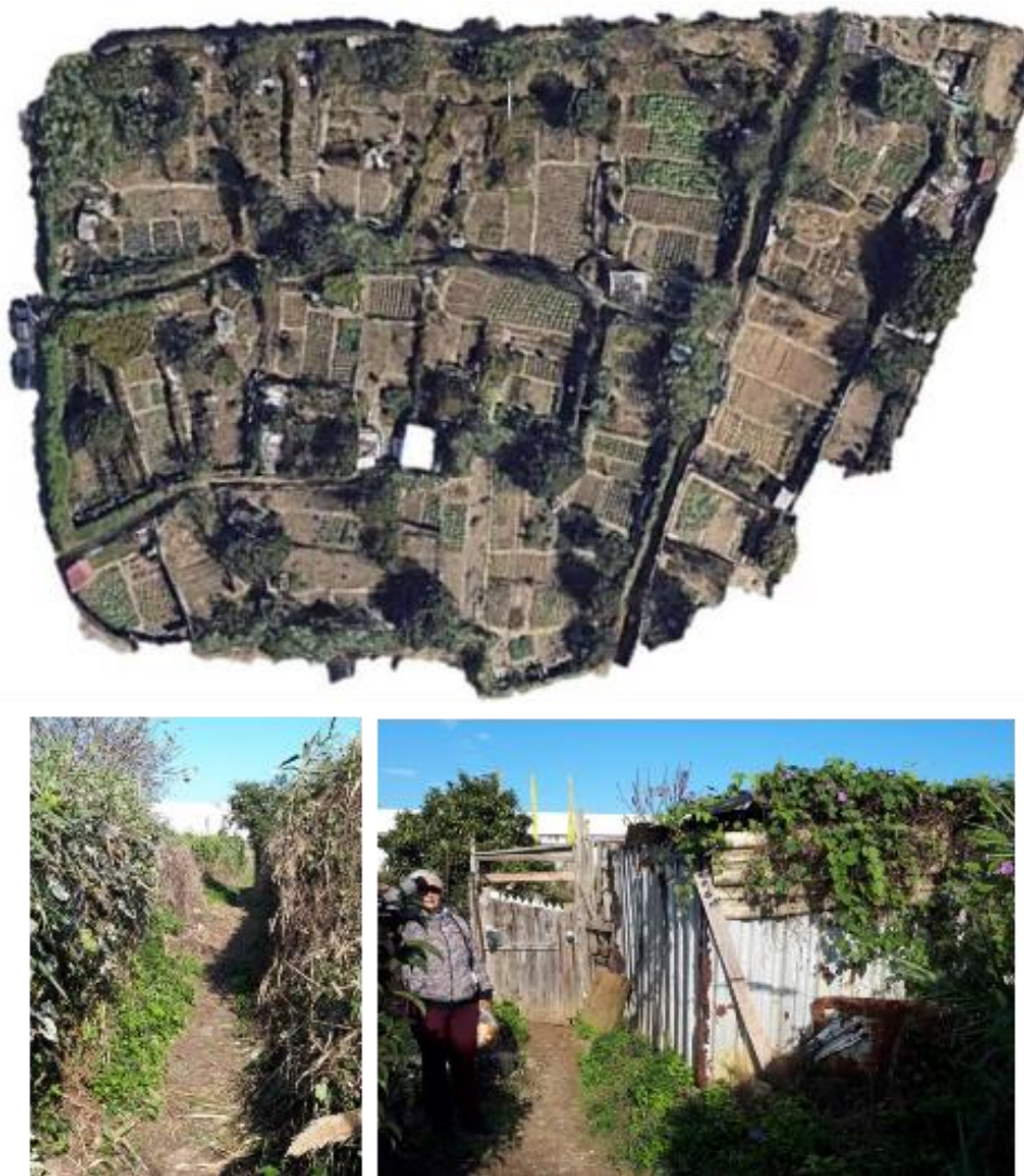
Figura 3. Abandono e desmazelo: fragmento de vista aérea e fotos do local - Horta espontânea ao lado do Parque do Fundão. Lisboa