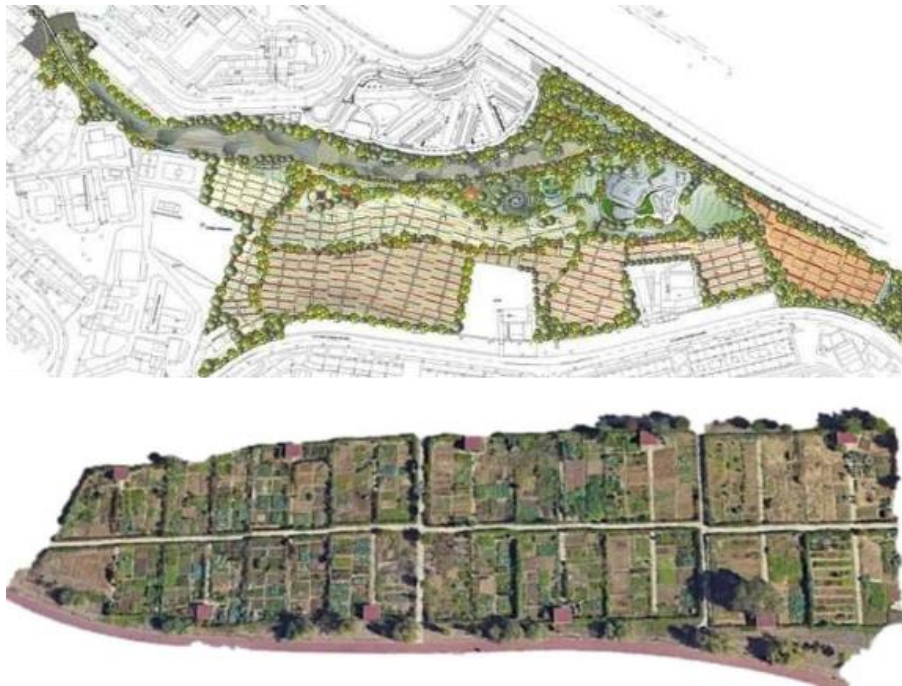
Figura 6. Ortogonalidade e repetição - Plano do Parque Vale de Chelas e Fragmento de vista aérea do Parque Quinta da Granja