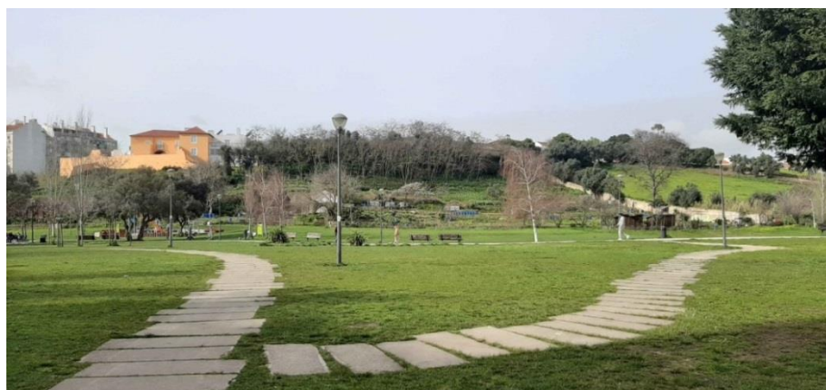
Figura 10. Paisagem “consumível” - Parque Quinta da Granja. Lisboa

Se a oferta em massa de hortas tematizadas em forma de “parques percorriáveis” ajuda a construir um irresistível apelo de urbe-ecológica, é importante observar também que ela transforma essas mesmas hortas e parques em “bens de consumo em construção” (Ginn; Ascensão, 2018). Para turistas, os parques passam a ser mercadorias exploráveis, em crescentes ofertas de excursões a pé ou de bicicleta, uma das quais eu mesma fui consumidora 10 . Para moradores, especialmente de uma classe média ambientalista (Ginn; Ascensão, 2018), os lotes passam a ser mercadorias adquiríveis, divulgadas em sedutores anúncios da Câmara Municipal de Lisboa nas redes sociais – “Sempre quis ter uma horta em Lisboa? Saiba que estão abertas (...) as candidaturas a hortas urbanas” (CML, 2017). (Figura 10)