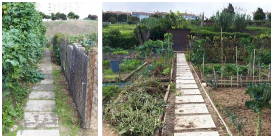
Figura 9. Racional, funcional e higiênico - Parque Vale de Chelas. Lisboa

Padronizados, funcionais e higiênicos, os parques perseguem um resultado imediato, palatável ao gosto instituído, modismos ou tendências que impõem “produtos verdes multinacionais” a contextos distintos (Montaner, 2012). São parques “gourmetizados” (Figura 9). Seu projeto, portanto, se afirma na contramão da crítica contemporânea que questiona a eficácia de soluções replicáveis e descontextualizadas, aos moldes modernistas, por abstraírem conflitos existentes e emergentes, idealizando um futuro “salvador e harmônico” (Montaner, 2012; Holston, 1995).