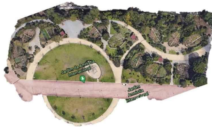
Figura 7. Fragmento de vista aérea – Parque Jardins de Campolide. Lisboa