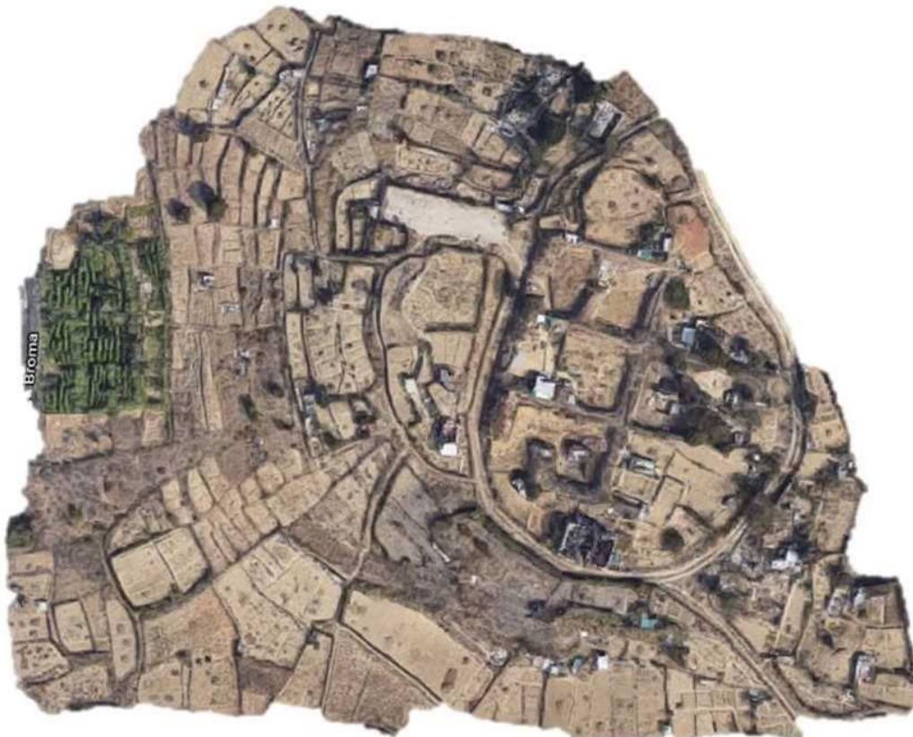
Figura 1. Desregrado e orgânico: fragmento de vista aérea - Horta no Condado. Chelas. Lisboa