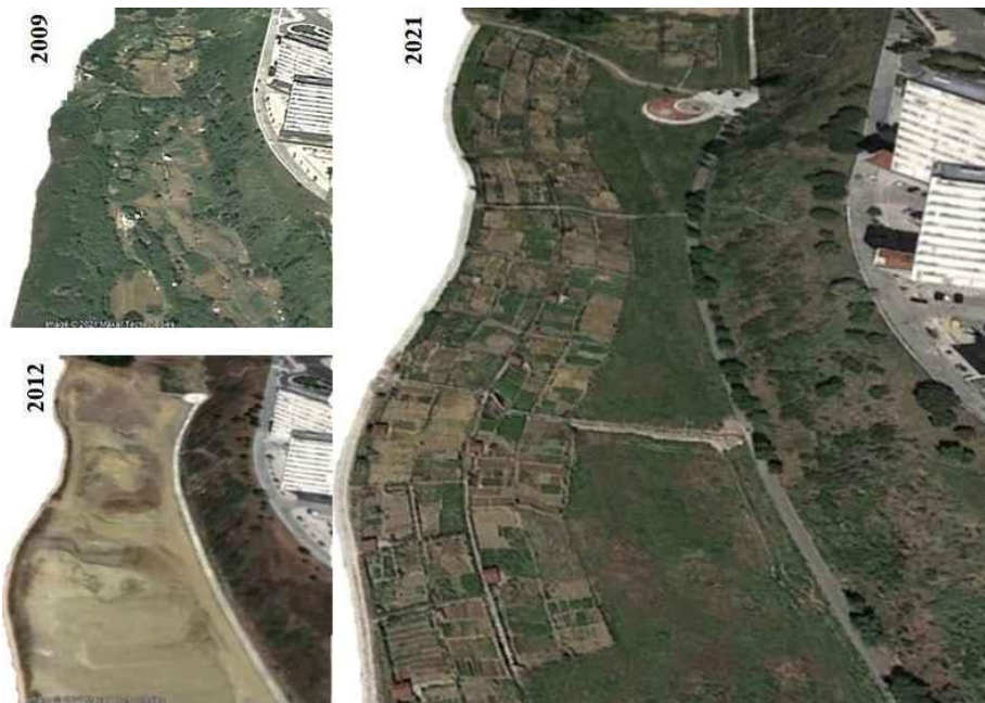
Figura 4. Tábula Rasa em Chelas – de hortas espontâneas a parque hortícola. Lisboa