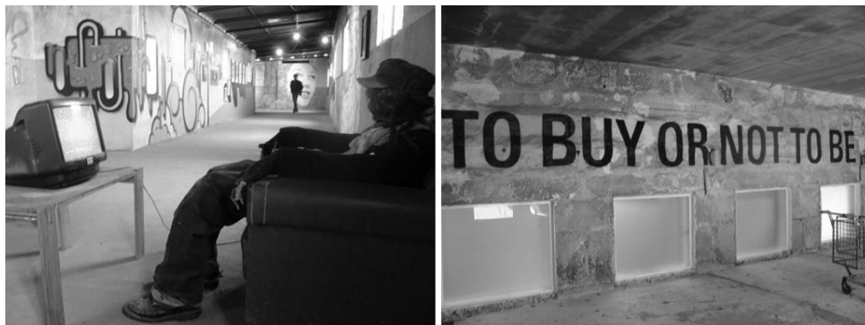
Figura 2: Visual Street Performance, na Fábrica Social, Porto, 2010 (cont.).