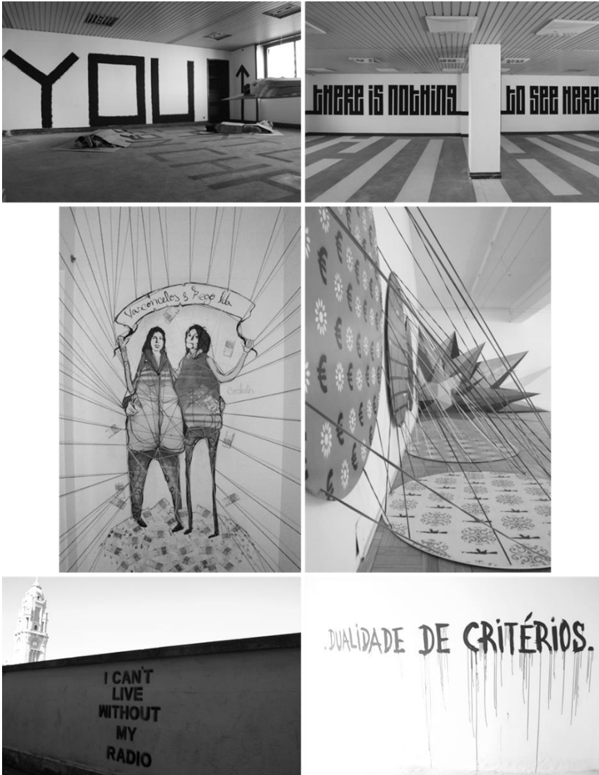
Figura 3: Street Art Axa Porto, Porto, 2014.

final de 2015, a seguradora colocou o edifício à venda, fazendo com que as actividades culturais deixassem o edifício antes do previsto. Porém, a vontade da autarquia é que as actividades que ali decorriam continuem num ou em mais espaços diferentes, equacionando a possibilidade de replicar esta experiência num outro edifício devoluto da cidade. Tal vem assim confirmar a sensibilidade das políticas urbanas em relação à cultura e ao seu potencial de transformação do espaço urbano e de revitalização e valorização económica e social da cidade.