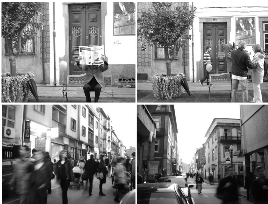
Figura 1: Inaugurações simultâneas na Rua Miguel Bombarda, Porto, 2008 (cont.).