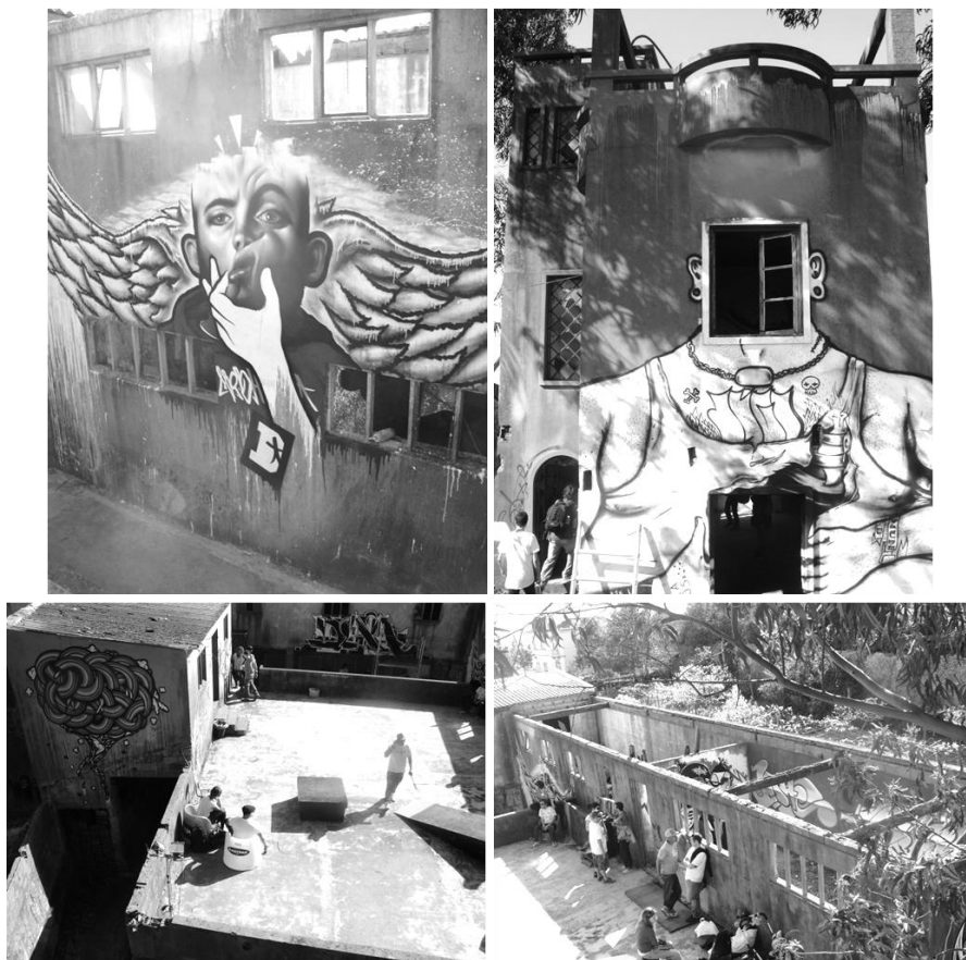
Figura 2: Visual Street Performance, na Fábrica Social, Porto, 2010.