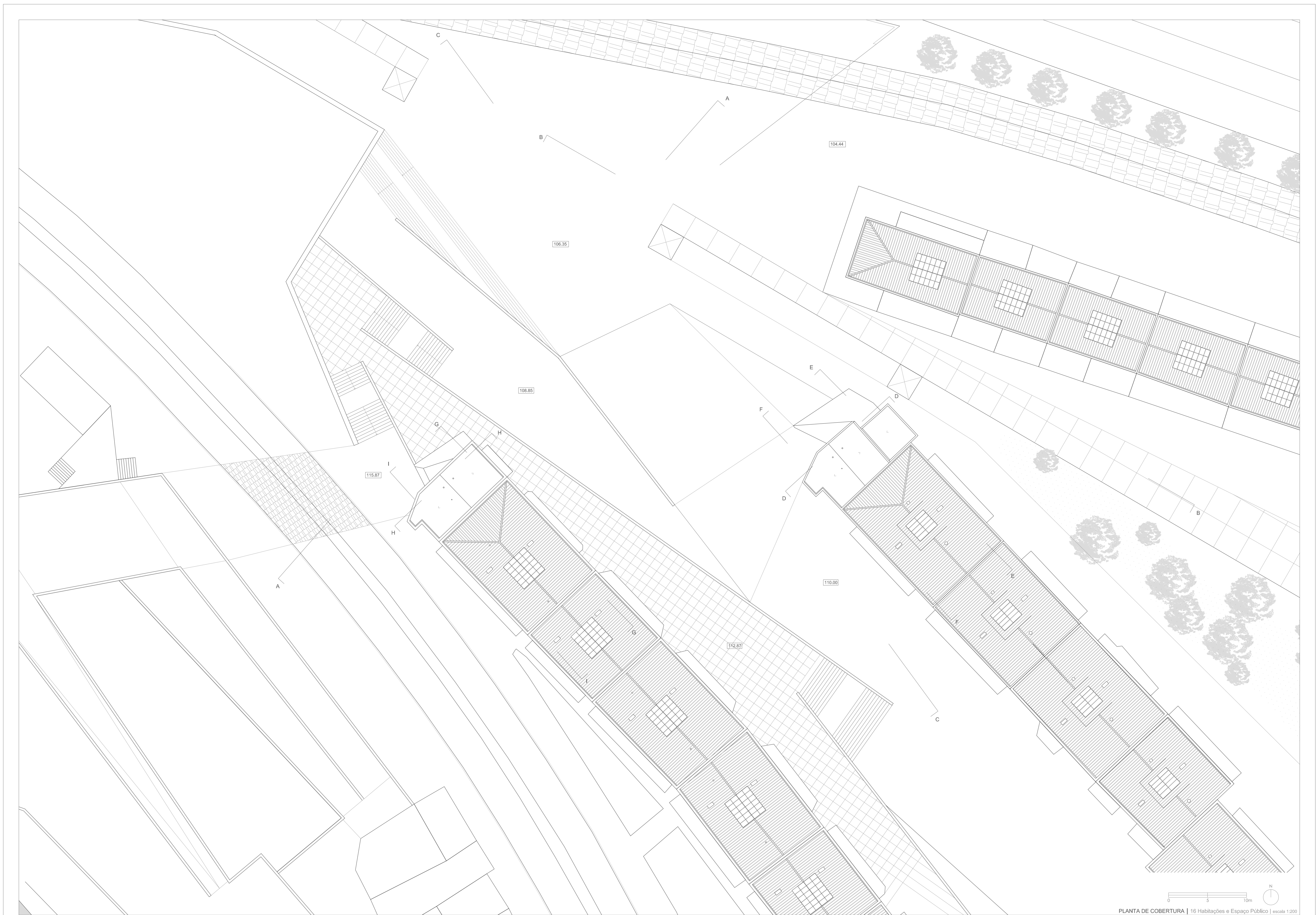
PLANTA DE COBERTURA | 16 Habitações e Espaço Público | escala 1:200 MA - ISCTE I. A. - SUBÁREA ANATÓMICO - 25494