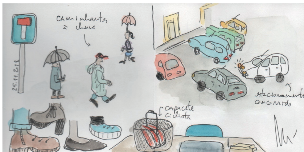
Figura 2 ▶ Caminhantes à chuva, capacete de ciclista e estacionamento concorrido