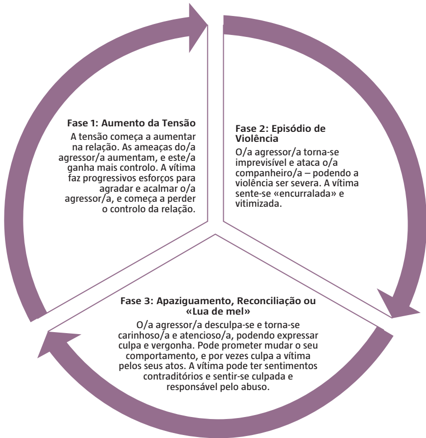
Figura 2 – Ciclo da violência conjugal

Nota: Adaptado de Richards, Noret e Rivers (2003): Violence & abuse in same-sex relationships: a review of literature.