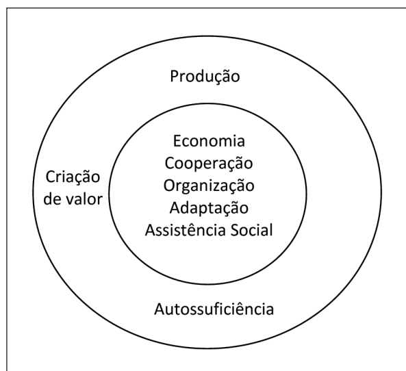
Figura 2 Modelo de gestão norueguês

Neste caso específico e tipicamente norueguês, cabe à Companhia Nacional de Petróleo (CNP) a responsabilidade de promover as operações comerciais e ao Ministério do Petróleo e Energia estabelecer metas a cumprir pelo setor, assim como planear e supervisionar todo o processo de licenciamento que lhe está inerente. Compreende ainda um órgão regulador, cuja função é a de fornecer supervisão técnica, cobrar taxas aos operadores que realizam