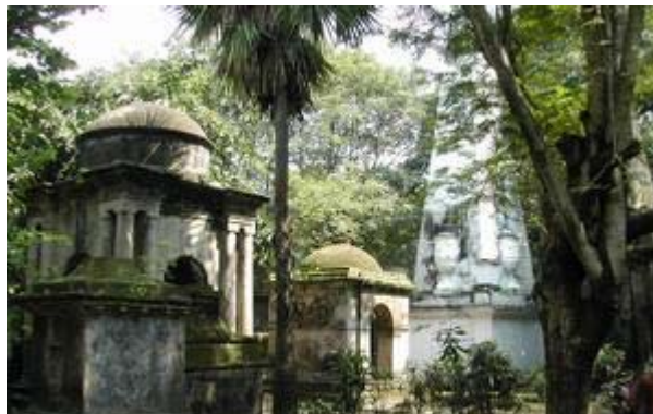
Fotografia 3 – South Park Street Cemetery, Kolkata, 2004. T6

A propósito desta fotografia, diz: «This is an amazing old cemetery from the 1700's, and an oasis of calm in the centre of Kolkata. Great atmosphere, complete with gothic crows» T6 .