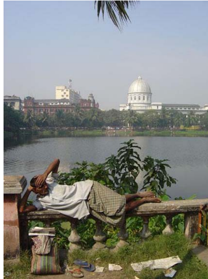
Fotografia 1 India, Calcutta - 2005. Homeless with a view. T13

sua estranheza é, antes, o não reconhecimento do Primeiro Mundo como objecto de desejo, por parte dos seus anfitriões; a falta de motivação para adquirir os atributos que para si são obviamente os parâmetros não problemáticos e desejáveis: espaços públicos higienizados em que os lixos e detritos da acção material são removidos do olhar.