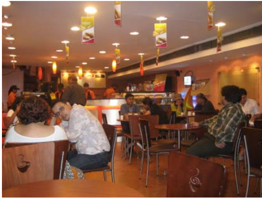
Fotografia 4 T21

said she could identify with them because she is was getting sick all the time T21 .