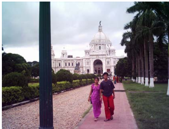
Fotografia 6 - Kolkata lover point. R13

Curiosamente, [BS], um jovem residente bengali terá dedicado uma das suas fotografias ao espaço de jardim vedado que circunda o Victoria Memorial, separando-o do restante espaço verde Maidan , para narrar, precisamente, sobre as recentes medidas implementadas de condicionamento no acesso e o seu efeito de decréscimo e mudança de tipologia na afluência deste espaço verde. O que, para si, o converte num espaço menos apelativo: