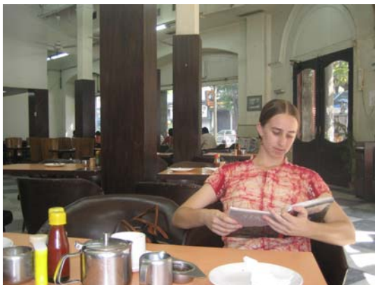
Fotografia 5 T21

Esta ideia de fuga ao contacto com a cidade e aos seus habitantes é reforçada pela narrativa que acompanha estas duas fotografias de interiores de cafés localizados em Park Street. À esquerda, o “Barista”, franchising da cadeia italiana, com o ambiente característico dos espaços de fast-food ocidentais, de cores fortes, iluminação artificial intensa, superfícies brilhantes e ar condicionado. À direita, “The Tea Table” (ou T3 como é designado em tom coloquial) relativamente novo, mas a operar no edifício centenário Park Mansions, com tectos altos, paredes brancas, colunas de suporte revestidas a madeira e mobiliário escuro, o que lhe confere um ambiente nostálgico de passado colonial. Em comum, o serviço ocidentalizado e a descontinuidade com o exterior proporcionada