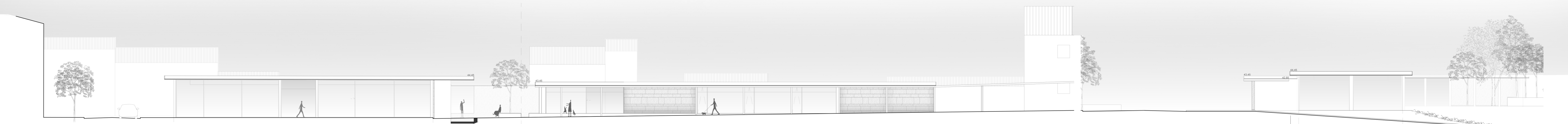
ALÇADO 2. PARA NORTE, PELO INTERIOR DO PARQUE, JUNTA DE FREGUESIA;