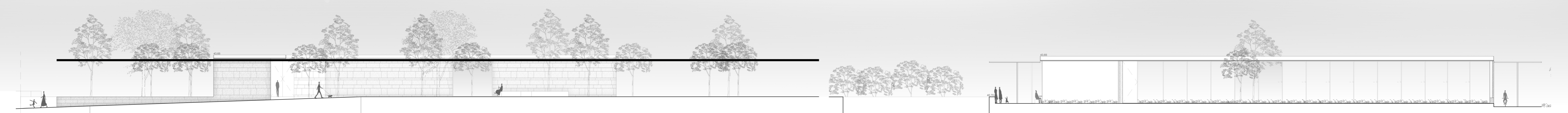
ALÇADO 8. PARA POENTE, C.M.S. SERVIÇOS DE ARQUIVO E DOCUMENTAÇÃO