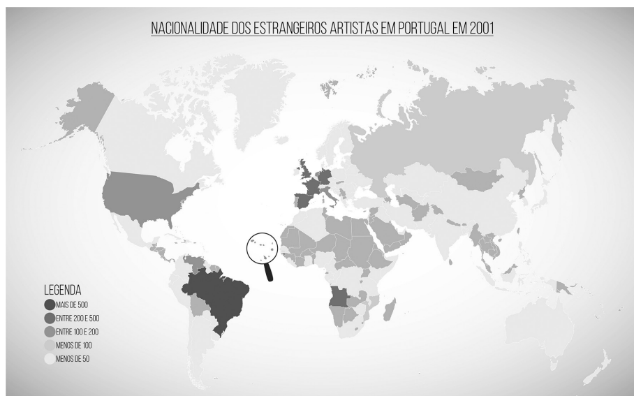
FIGURA 3 Profissões Genericamente Artísticas e Culturais (GAC) por país de origem, em 2001