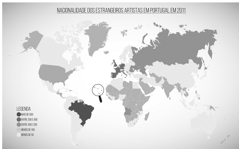
FIGURA 2 Profissões Genericamente Artísticas e Culturais (GAC), por país de origem, em 2011