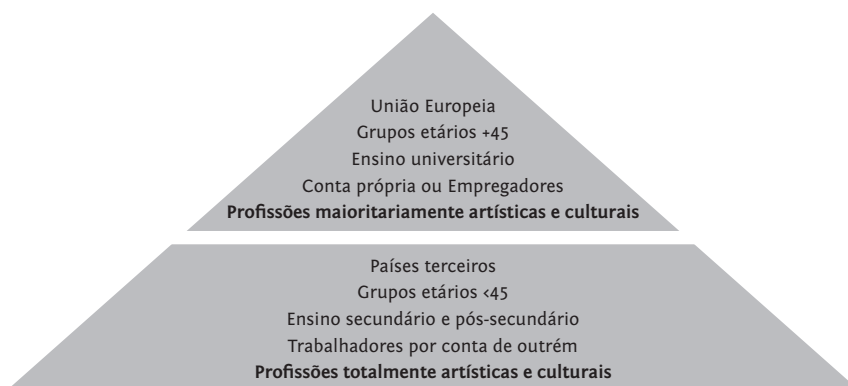
FIGURA 5 Segmentação sociodemográfica e profissional dos grupos de profissionais maioritária ou totalmente artísticos, 2011*

Assim, de 2001 para 2011 o campo dividiu-se naquilo que parecem ser, por um lado, movimentos migratórios mais antigos e/ou de indivíduos mais velhos, mais formalmente escolarizados, com maior tendência para exercer a sua atividade por conta própria ou como empregador e oriundos da UE (MAC); e por outro, movimentos migratórios mais recentes e/ou de indivíduos mais jovens, sem um nível de escolaridade superior e a exercerem atividade profissional por conta de outrem (TAC) (Figura 5). Esta dicotomização traduz-se