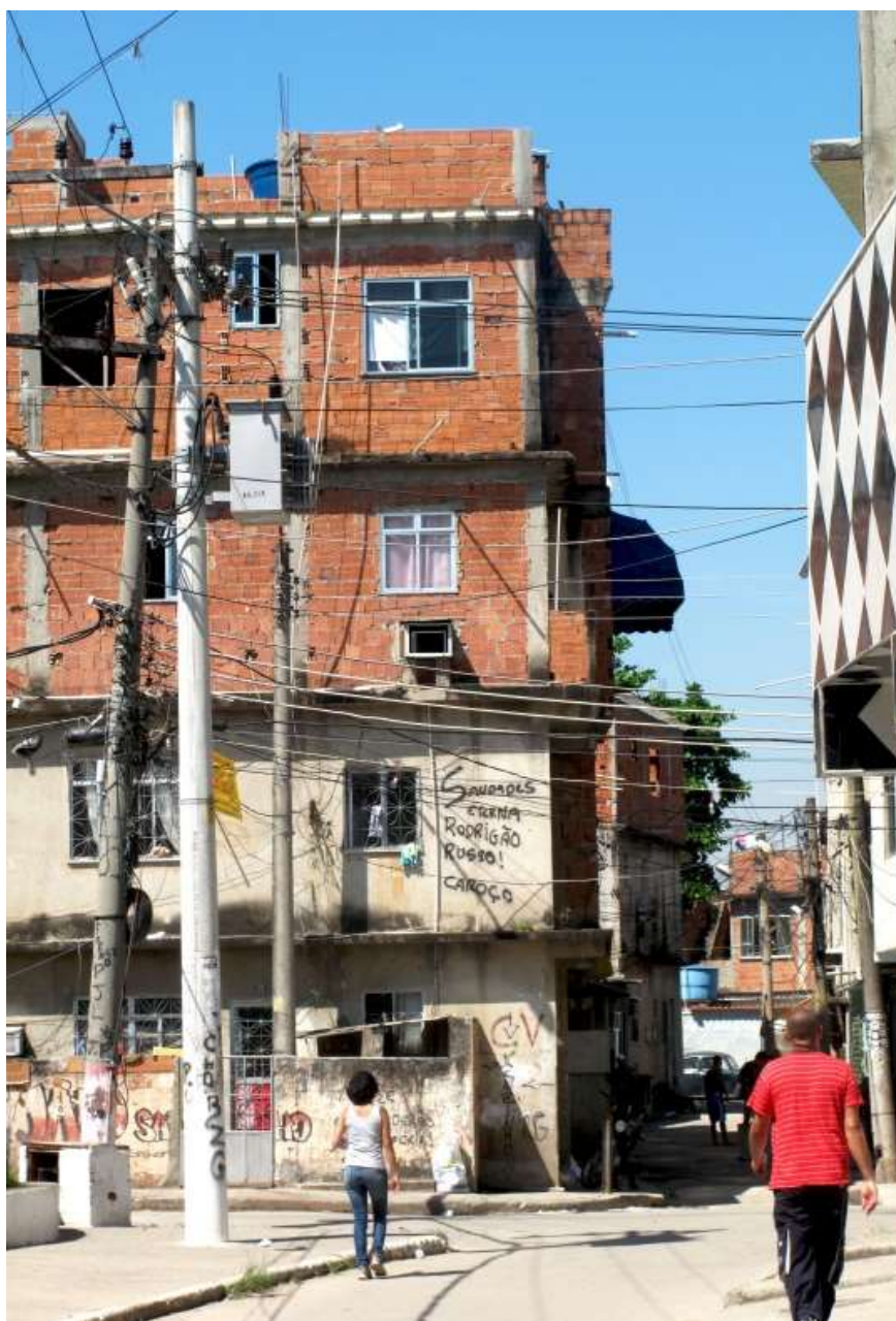
Figura 2. Verticalização das casas da Maré