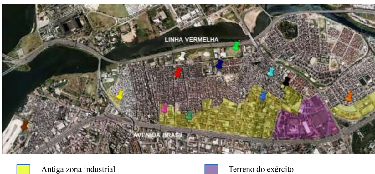
Figura 3. Mapa dos Equipamentos Culturais da Maré

Na figura 3 podemos localizar as ONG e os equipamentos culturais mais importantes, assim como a antiga zona industrial (mancha em amarelo) comprimida entre a Maré e a Avenida Brasil.